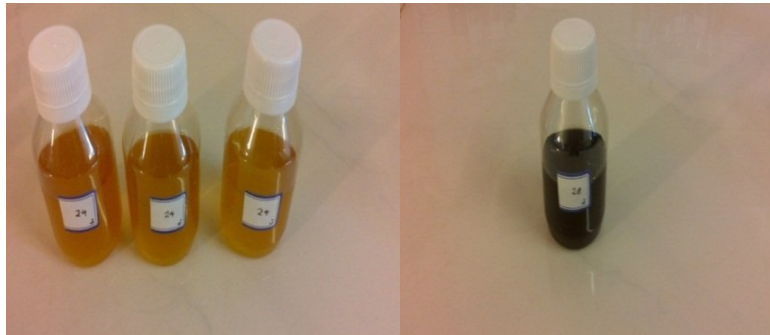
شکل ۳: پیگمان های مورد نظر برای اندازه گیری توانایی جذب اشعه UV (تعیین فاکتور SPF)

امروزه مطالعات زیادی بر روی رنگدانه های میکروبی و کاربرد آنها در صنایع مختلف در حال انجام است. از طرف دیگر امروزه توجه قابل ملاحظه ای نیز به استفاده از منابع طبیعی در مواد غذایی، آرایشی و سایر صنایع شده است (۱ و ۵). زیرا بسیاری از رنگدانه های مصنوعی که به طور گسترده در مواد غذایی، لوازم آرایشی و بهداشتی و فرآیندهای تولید دارو استفاده می شوند خطرات زیادی را به دنبال دارند (۱۷). به منظور جداسازی پیگمان های میکروبی می توان از حلال آب و DMSO استفاده نمود. سد ماک (Sedmak) و همکاران در سال ۱۹۹۰ از حلال شیمیایی DMSO برای استخراج رنگدانه کارتنوئید استفاده کردند و از آن به بعد در تمام نقاط دنیا از این روش استفاده می گردد (۱۸). لایت (Light) و همکاران در سال ۱۹۶۸ از برخی از گونه های جلبک به عنوان مثال کلامیدوموناس ( chlamydomonas ) غلظت بالایی از رنگدانه قرمز آستاگزاتین را جداسازی کردند.