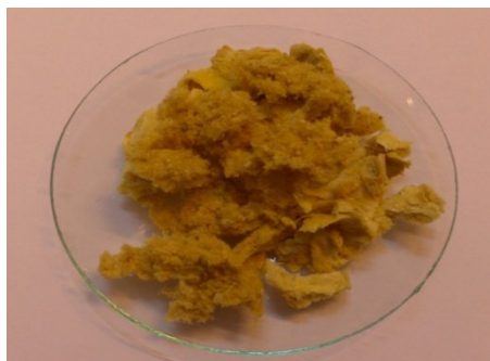
شکل ۴: رنگدانه خشک حاصل از قارچ اسپیریلیوس

امروزه مطالعات زیادی بر روی رنگدانه های میکروبی و کاربرد آنها در صنایع مختلف در حال انجام است. از طرف دیگر امروزه توجه قابل ملاحظه ای نیز به استفاده از منابع طبیعی در مواد غذایی، آرایشی و سایر صنایع شده است (۱ و ۵). زیرا بسیاری از رنگدانه های مصنوعی که به طور گسترده در مواد غذایی، لوازم آرایشی و بهداشتی و فرآیندهای تولید دارو استفاده می شوند خطرات زیادی را به دنبال دارند (۱۷). به منظور جداسازی پیگمان های میکروبی می توان از حلال آب و DMSO استفاده نمود. سد ماک (Sedmak) و همکاران در سال ۱۹۹۰ از حلال شیمیایی DMSO برای استخراج رنگدانه کارتنوئید استفاده کردند و از آن به بعد در تمام نقاط دنیا از این روش استفاده می گردد (۱۸). لایت (Light) و همکاران در سال ۱۹۶۸ از برخی از گونه های جلبک به عنوان مثال کلامیدوموناس ( chlamydomonas ) غلظت بالایی از رنگدانه قرمز آستاگزاتین را جداسازی کردند.